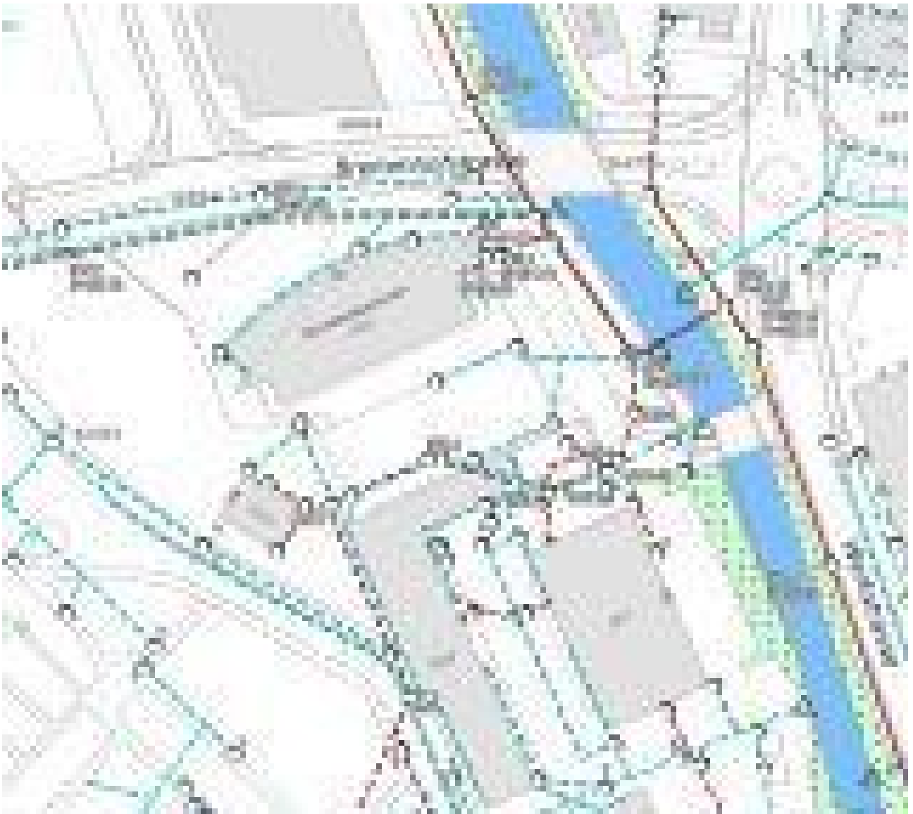
Leitungskataster Strom + Wasser + Gas + Abwasser