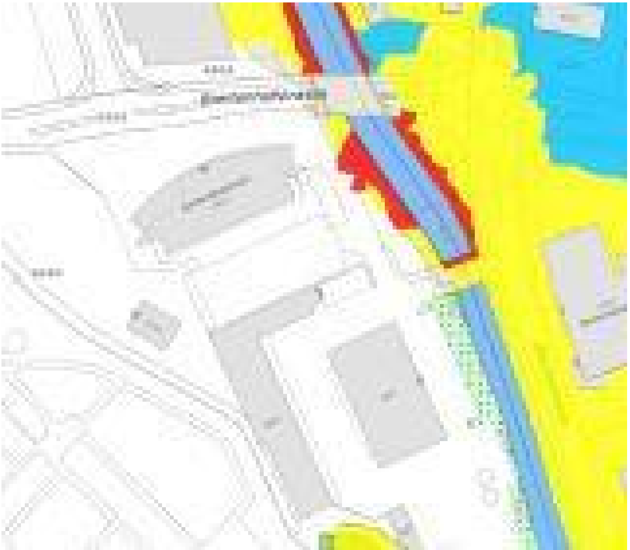
Kataster der belasteten Standorte