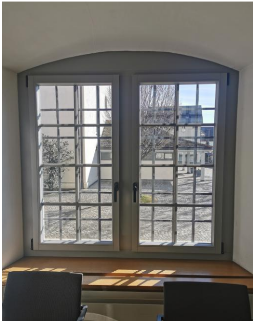
Neues Fenster Korridor