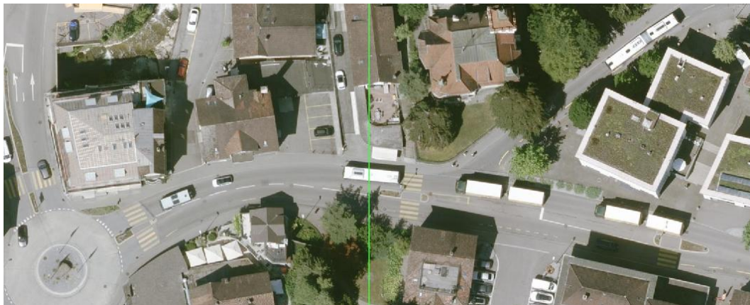
Situation Dorfstrasse heute

In Rüti sind insbesondere Anpassungen am Knoten Dorfstrasse/Bahnhofstrasse vorgesehen. Dazu gehören die baulichen Verlängerungen der Mittelinseln westlich und östlich der Ausfahrt aus der Bahnhofstrasse mit der Aufhebung des Fussgängerstreifens bei der westlichen Insel sowie neue Markierungen, die Realisierung der Lichtsignalanlage LSA 278 zur Busbevorzugung und die Ergänzung bzw. Erneuerung der Rohranlagen für die Betriebs- und Sicherheitsausrüstung.