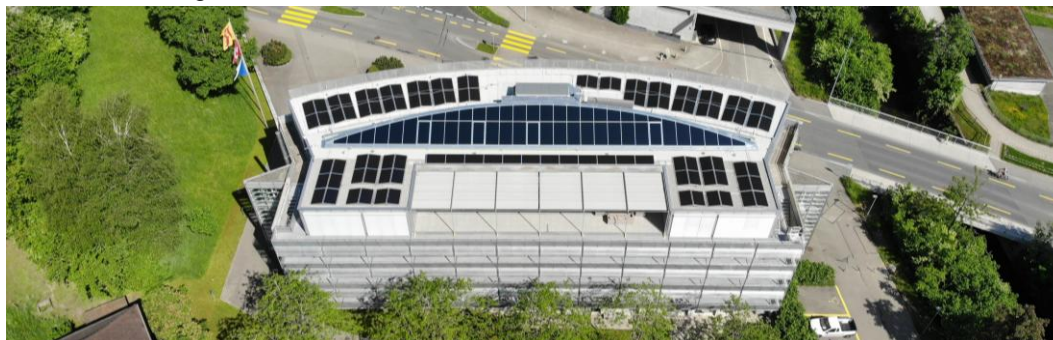
Dachaufsicht nach Sanierung Gemeindehaus

Um den sommerlichen Wärmeschutz nach der Norm SIA 180:2014, (Wärmeschutz, Feuchteschutz und Raumklima) im Gebäude weitgehend zu erreichen, müssen jedoch noch weitere Massnahmen, im Speziellen an der Fassade, umgesetzt werden. Die entsprechenden Arbeiten wurden abgeschlossen und die Investition Ende Dezember 2021 in Betrieb genommen.