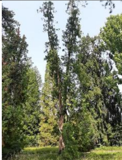
Baum NR. 81 Thuja (Thuja occidentalis)