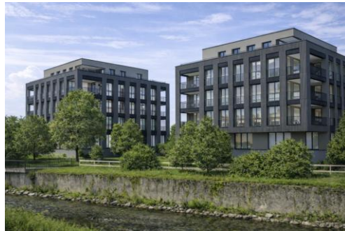
Visualisierung bewilligtes Neubauprojekt

Für das Areal liegt bereits ein rechtskräftig bewilligtes Neubauprojekt im Minergie-Eco Standard mit Anschluss an den Energieverbund Rüti Zentrum und geplanter PV-Anlage auf den beiden Flachdächern vor. Die Anpassung des Baurechtsvertrags bildet die vertragliche Voraussetzung für dessen gesamtheitliche Realisierung auf der neu gebildeten Parzelle.