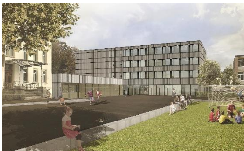
Visualisierung Vorprojekt 7. November 2022

Aufgrund der Überprüfung des Vorprojektes wurde der Raumbedarf durch die Schule Rüti nochmals aktualisiert dabei ist ein Mehrbedarf an Unterrichtsräumlichkeiten gegenüber dem Vorprojekt aus dem Jahr 2019 ausgewiesen. Der angezeigte Mehrbedarf an Unterrichtsräumen soll im aktualisierten bzw. überarbeiteten Vorprojekt mit einem zusätzlichen Geschoss abgedeckt werden. Das überarbeitete Vorprojekt und die Kostenschätzung datieren vom 7. November 2022.