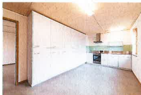
Ansichten innen WohnWerk bei Fertigstellung im Juni 2020

Die entsprechenden Arbeiten wurden abgeschlossen und das WohnWerk konnte im Juni 2020 in Betrieb genommen werden. Im Mai 2022 konnten die zweijährigen Garantieabnahmen für das WohnWerk durchgeführt und ohne wesentliche Mängel abgeschlossen werden.