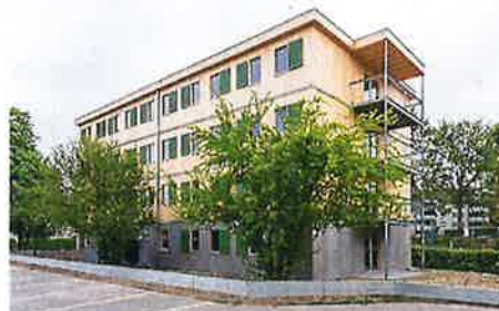
Ansichten aussen WohnWerk bei Fertigstellung im Juni 2020