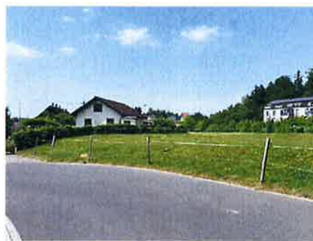
Ansicht Tunnelstrasse 6 auf Grundstück Kat. Nr. 6719