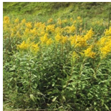
Goldrute, Solidago canadensis und gigantea