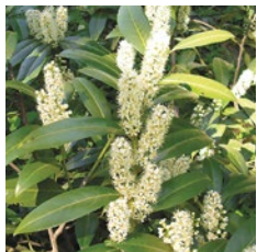
Kirschlorbeer, Prunus laurocerasus