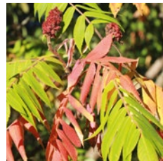
Essigbaum, Rhus typhina