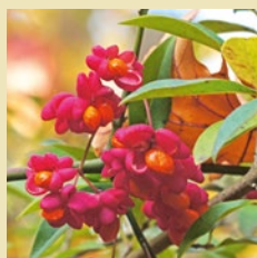
Pfaffenhüttchen, Euonymus europaeus