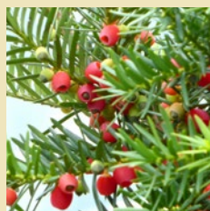
Eibe, Taxus baccata