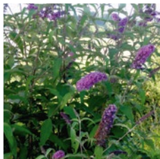
Sommerflieder, Buddleja davidii