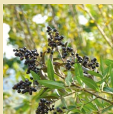
Liguster, Ligustrum vulgare