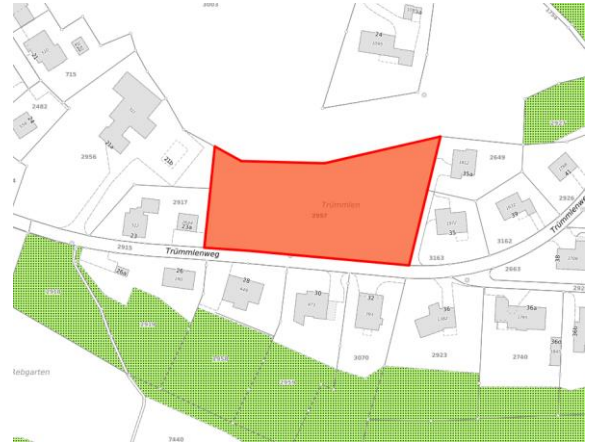
Abbildung 2: Parzelle Grundstück Kat. Nr. 2957, Trümmlen

Die Hochstamm-Feldobstbäume auf Kat. Nr. 2957 sind weder in der kommunalen Verordnung über den Natur- und Landschaftsschutz (SVO Rüti 2018, komplette Überarbeitung der Verordnung über den Natur- und Landschaftsschutz der Gemeinde Rüti vom 24.10.1994) noch im kommunalen Inventar der Natur- und Landschaftsschutzobjekte aufgeführt. Dennoch wurde eine Schutzabklärung angeordnet, da das Grundstück zeitnah überbaut werden soll und das Gebiet «Sunnengarten» ebenfalls im Bundesinventar ISOS (Inventar der schützenswerten Ortsbilder der Schweiz) enthalten ist.