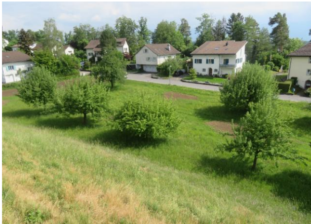
Abbildung 1: Aufnahme Grundstück Kat. Nr. 2957 vom 6. Mai 2020